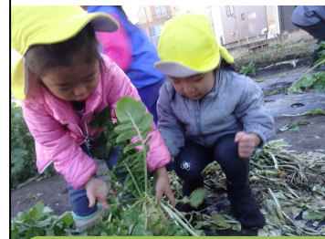
大根抜きをしました！

昨年12月には大根抜きを行いました。3歳児は自分の好きな小さな大根を引っっこ抜く、4歳児と5歳児は自分で選んだ大根を自分の力で頑張って引き抜く。「自分で選び自分の力でやってみる」気持ちを大切におみやげに持って帰るとはりきる子ども達でした。「こんな大きな大根採れたよ」子ども達は家族の役にたち、感謝され自分も家族の一員なんだと意識もあり、頑張る姿を微笑ましく思いました。