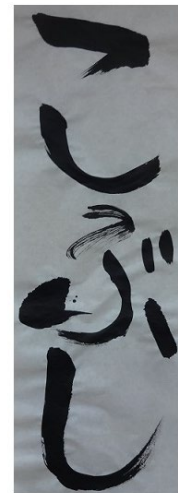
「字の書き方教室」 5歳児 めろん組